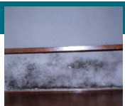
アルテルナリア(ススカビ)

カビは湿気が多い浴室や台所、結露した壁などに発生するクラドスポリウム(クロカビ)やアルテルナリア(ススカビ)と、乾燥した場所(靴箱や押し入れなど)に発生するアスペルギルス(コウジカビ)やペニシリウム(アオカビ)があり、これら生活環境にみるカビは湿度状態により異なります 7) 。