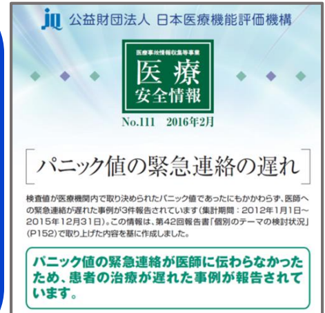
パニック値の緊急連絡遅れの問題